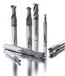
JSE512-JSE513 - JSE514